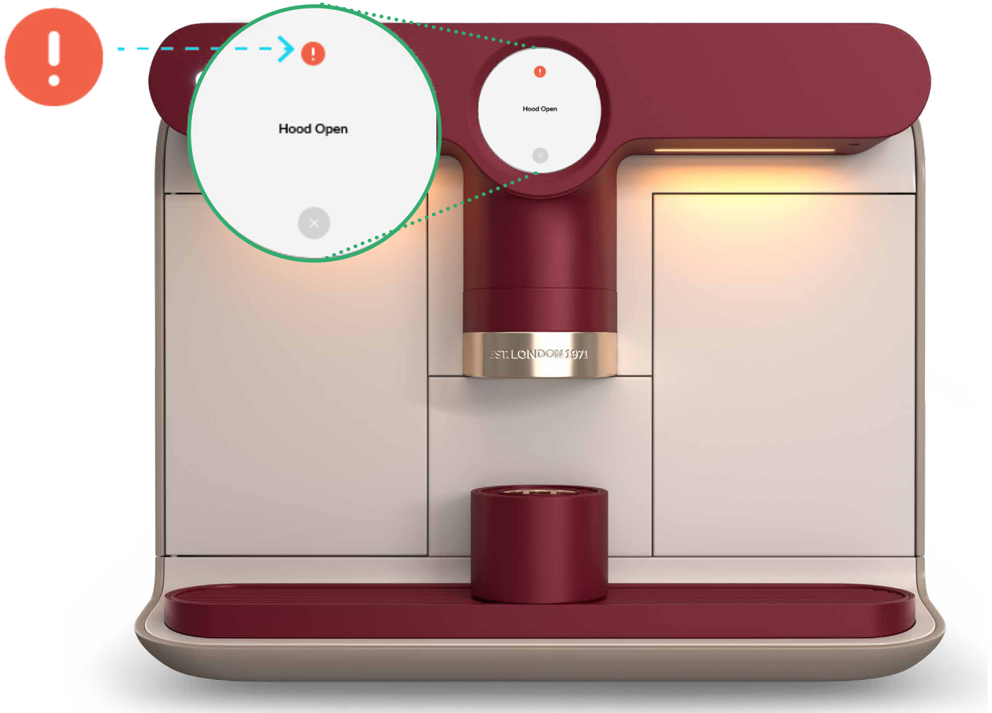
Beispiel für einen Alarm auf dem Attract-Bildschirm.

Alarmsymbole auf dem Attract-Bildschirm liefern wichtige Informationen über den Maschinenstatus und zeigen an, dass eine Aktion erforderlich ist.